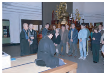
起きて半畳、寝て一畳 「単」