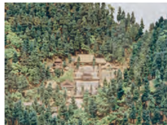
江戸時代の永平寺（模型）