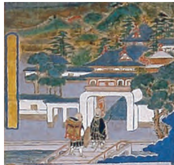
道元禅師絵伝（1～2月展示）